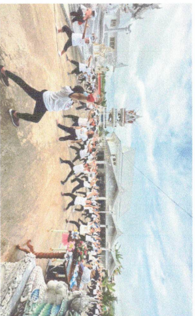
สุขภาพดี

สำนักงานสาธารณสุขอำเภอหนองหาน จังหวัดน่าน